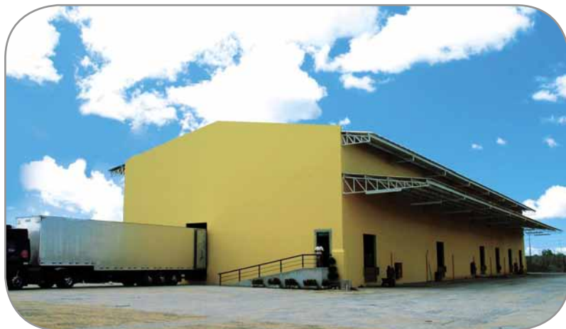
Um novo galpão de 1.400 m 2 armazena os produtos da distribuidora

Como resultado de uma indústria que cresce a cada dia e acumula bom desempenho em gestão, a Multdia está passando por uma ampliação física. A equipe está crescendo e por isso a área administrativa ganhou um segundo andar, que comporta os setores de suprimentos, comercial, contabilidade e gestão de pessoas. Além disso, a área da indústria tem um novo espaço. Um galpão de 1.400 m 2 irá abrigar a DIA e o prédio onde estava instalada a distribuidora passou a fazer parte da Multdia.